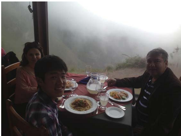
新しいホストファミリーと