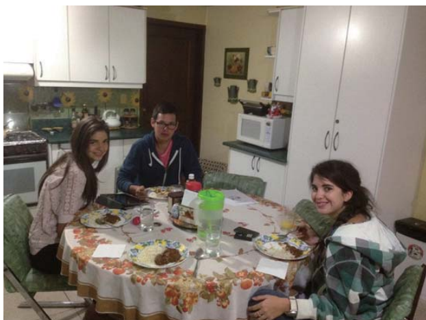
カレーをご馳走した時の写真