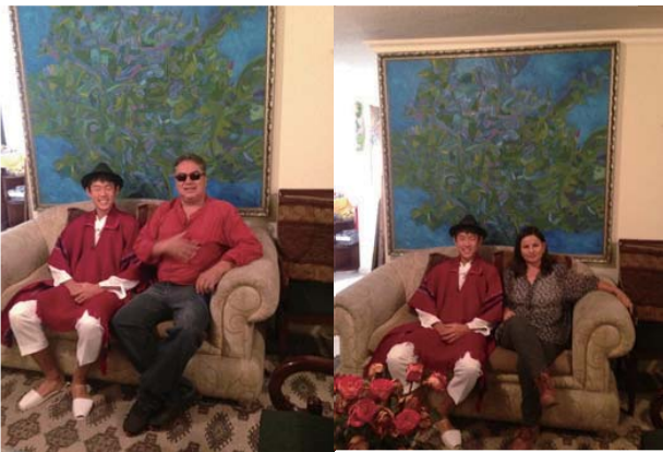
家で試しに伝統的な衣装を着たときに一緒に写真を撮りました。ジョークが2人とも大好きで笑いが絶えない家族です。