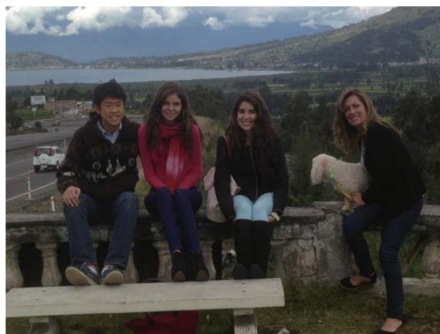
Otavalo への道への途中で寄った Lago de San Pablo (聖パブロ湖)

自分は、この5か月エクアドルで生きてきて、この国の色々な魅力を見出し、自分は将来、何かしらエクアドルに関係した仕事に就きたいと思うようになりました。言語関係、日本食関係、貿易業、そして観光業など選択肢は本当にたくさんあります。今は何をやるか全然決めていませんが、これから、ここでできたつながりを大切に、多くの日本人の方々から、学び、学んだことを自分の将来へ活用していきたいです。