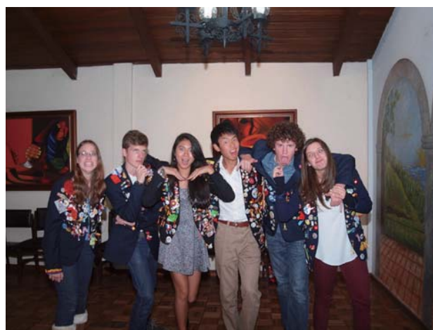
Los Chilllos RC 留学生全員集合 (変顔)