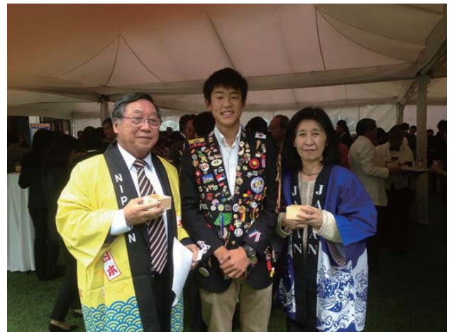
大使公邸新年会にて 大使と大使の奥様とともに