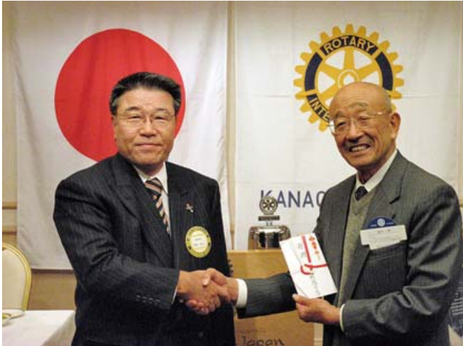
クラブより井戸4本分の寄付金贈呈