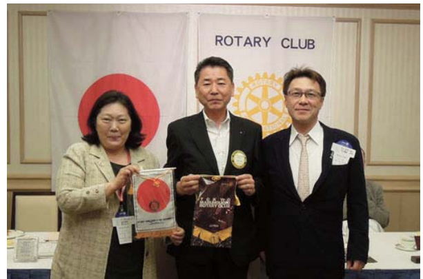
ビジターでお越しの東京丸の内RCとバナー交換