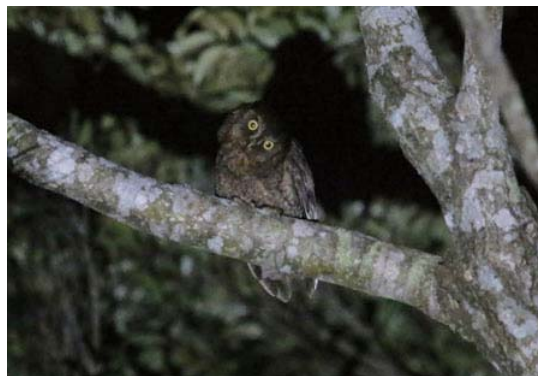
リュウキュウコノハズク