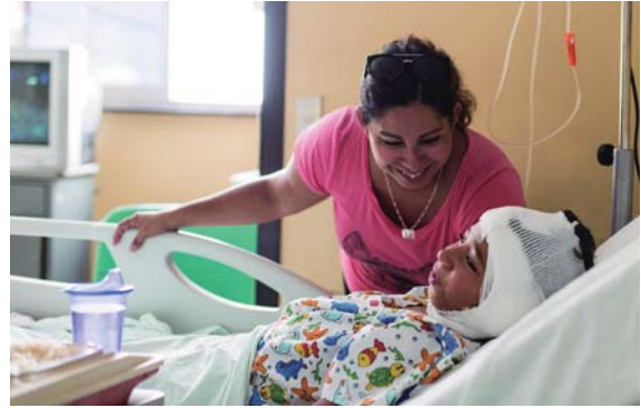
ロータリーニュース

冒頭で元患者と再会したロマンさんは、その後、その女性をロータリー行事に招待しました。300人の会員を前に、彼女は自分の人生を変えた手術について講演。彼女の輝くロータリアンスマイルに、多くが涙を流しました。