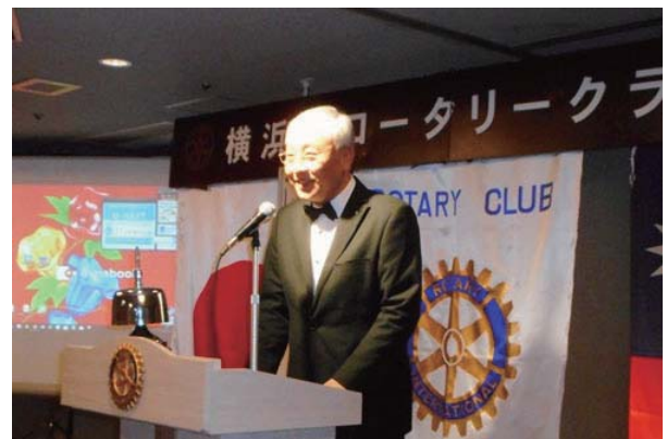
第3522地区 郭繼勳ガバナー ご挨拶