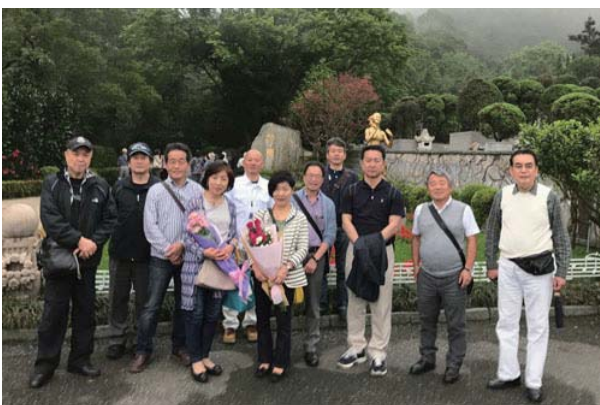
テレサ・テンのお墓にて