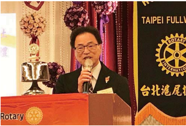
台北滬尾ロータリークラブ創立 11 周年記念式典にて