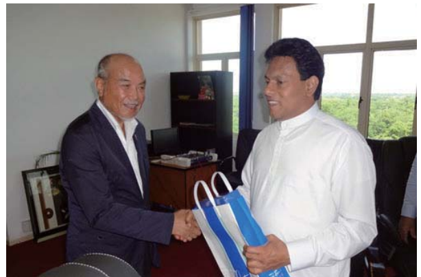
クラブからのお土産を渡しました