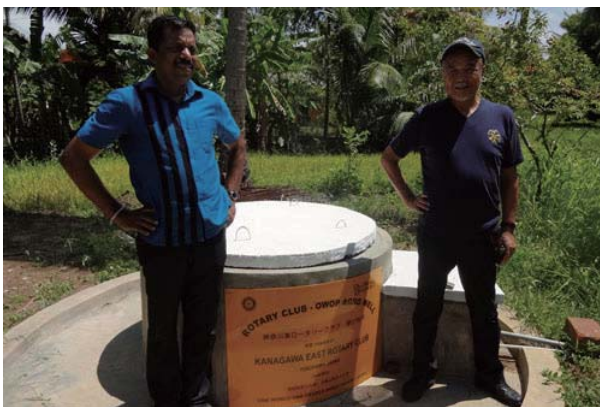
幼稚園の横に掘られている神奈川東RCの井戸。水をモーターで幼稚園にひいております