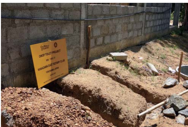
神奈川東RCの寄付で作っているトイレ。まだ未完成

神奈川東RCが、長年取り組んできた井戸、また水の問題は、スリランカの皆様方に変感謝されております。一度、クラブの皆様もスリランカに出向いて、我クラブの行っているボランティアをご自身の目で実感して頂ければ幸いです。