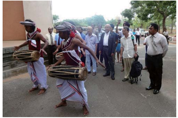
北中央州の公社前で歓迎されました