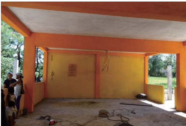
他のボランティアクラブが建てている幼稚園。50坪位で百数十万円だそうです