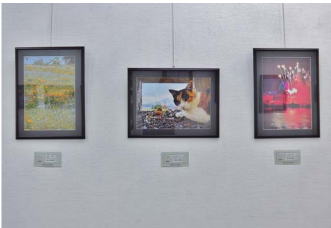
出品者 角田 伯雄 会員