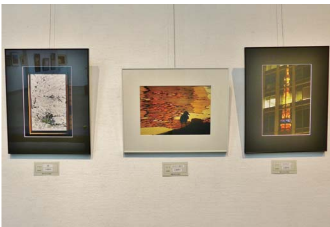
出品者 小池 将夫 会員