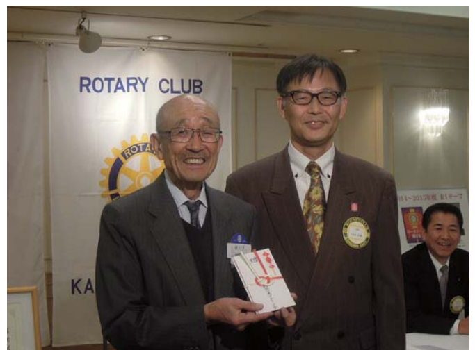
クラブより寄付金贈呈