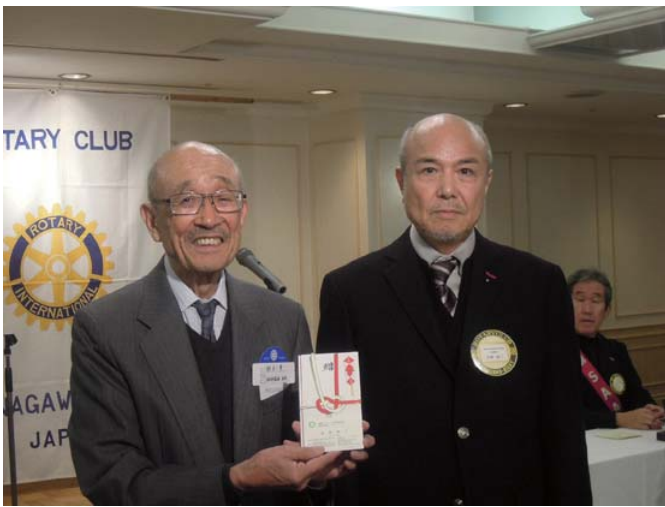
アローメディカル(株)より寄付金贈呈