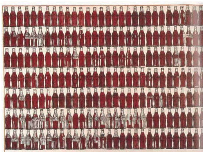
ピエト・モンドリアン 「グリーンコココーラボトル」1962年