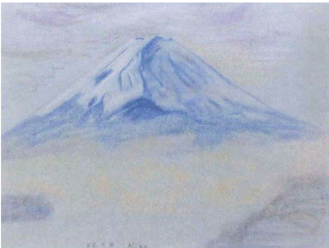
パウル・クレール 「パルナツソス山」1932年