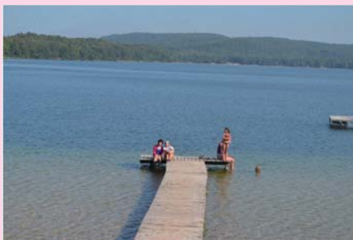
ホストシスターと私 宿泊先の目の前にある小さな湖にて