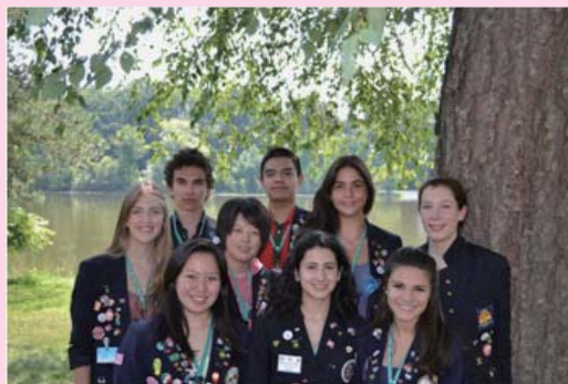
ドイツ・チリ・トルコ・タイ・クロアチア・ブラジル・デンマークからの留学生達と

というわけで本格的な学校生活は9月からになりますので、学校の様子は次回以降にお知らせしたいと思います。