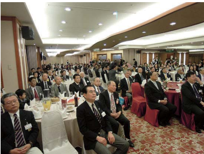
式典会場内の風景