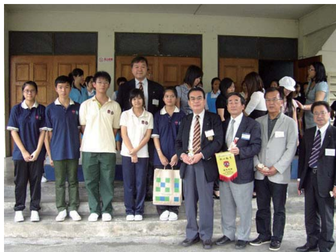
シャンタオ・セカンドリー・スクールにて