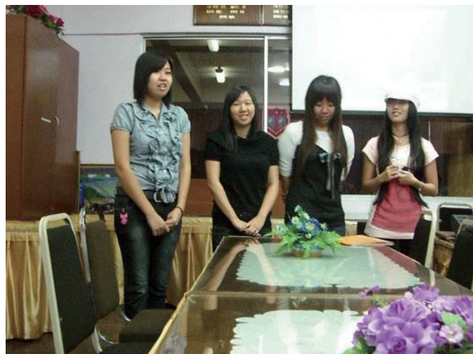
3年前に横浜へ来た4名の女子高生