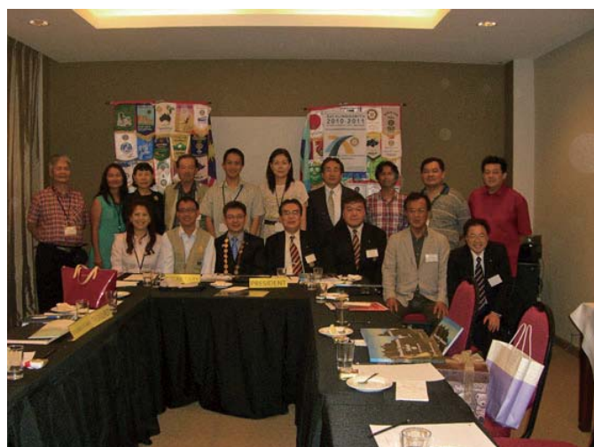
ルーヤンRCの例会に出席

【次号は吉田隆男ロータリー情報委員長の『ルーヤンRC訪問報告 vol. 2』を掲載致します。】