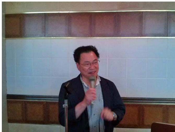
植田親睦委員長挨拶