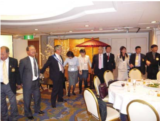
最後に「手に手つないで」をみんなで大合唱