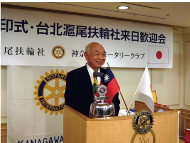
ガバナー特別代表 林錫卿 様 挨拶