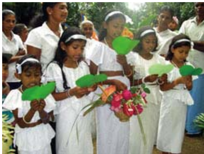
これは白の正装で、私達に歓迎の歌を歌ってくれた女の子達です。

式の終了後、まずは私達の為に近所の家で小宴、その後子供達もお菓子や果物を頂きます。