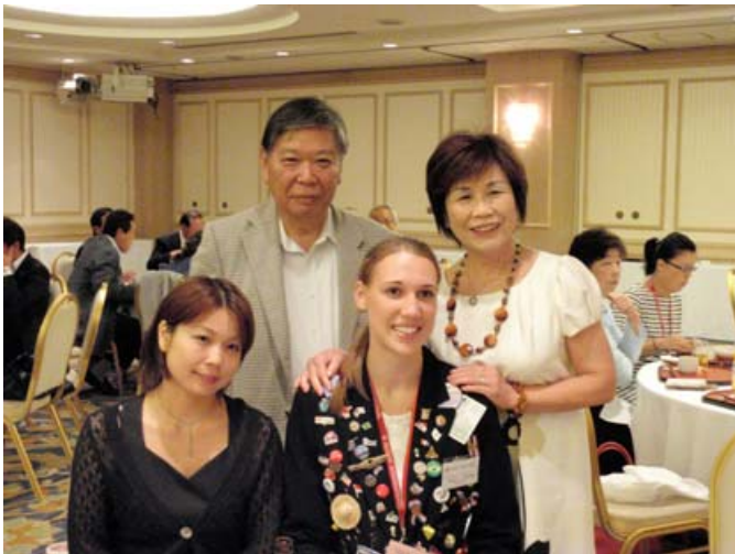
ホストファミリー(梅崎会員御一家)