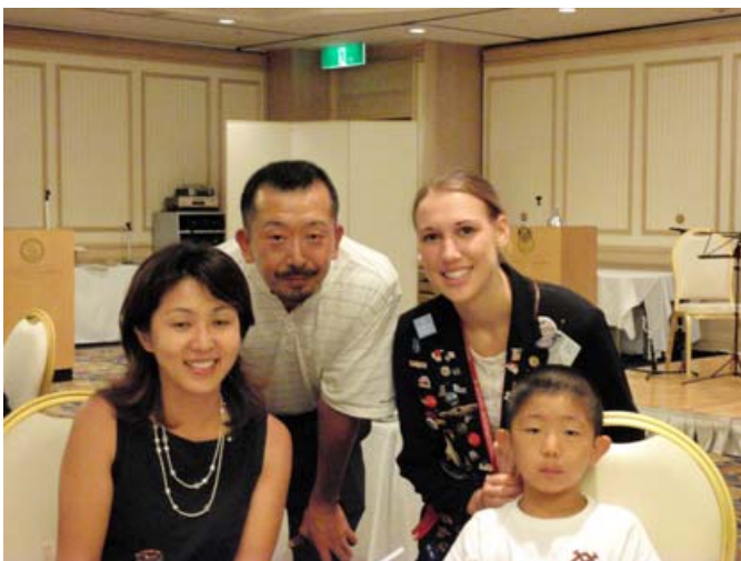
ホストファミリー(館野会員御一家)