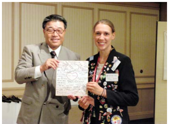
さよならAbbey また会う日まで…