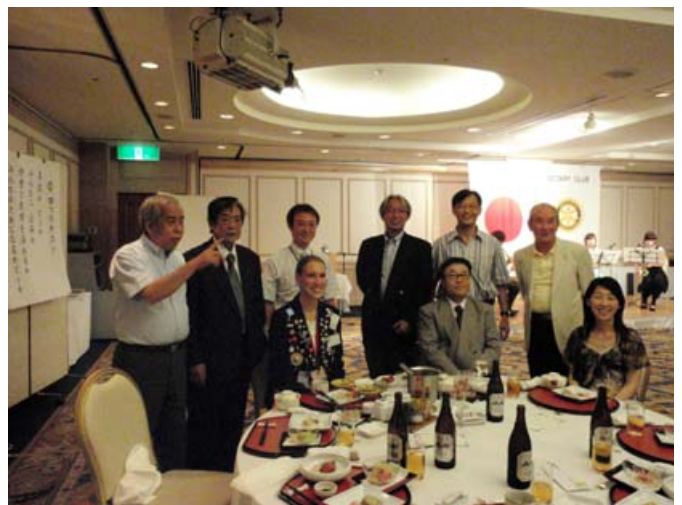
テーブルごとに記念撮影