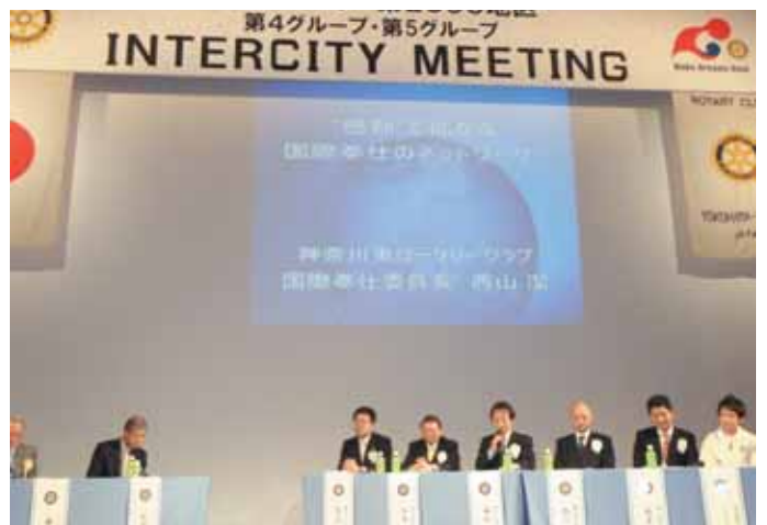
パネルディスカッションの西山委員長