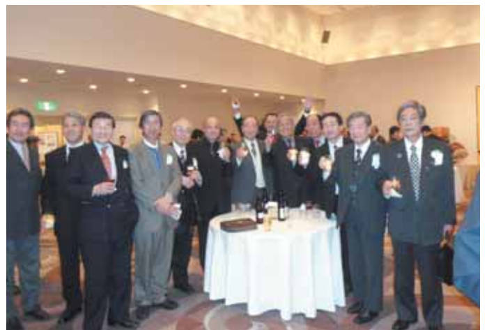
懇親会の集合写真