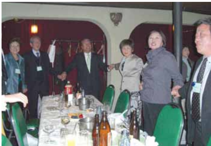
ロータリーソング (手に手つないで)