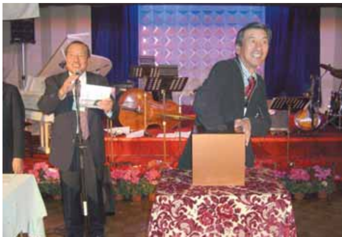
お楽しみ抽選会 親睦活動委員会