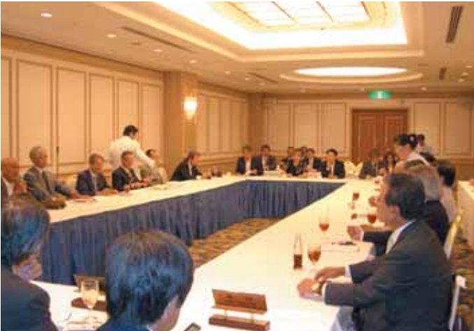
ガバナー清水良夫氏を囲み