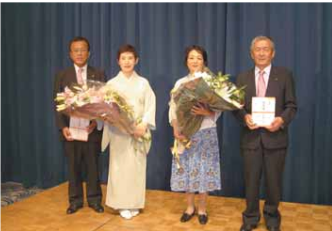
ホテルニューグランド3階 ペリー来航の間