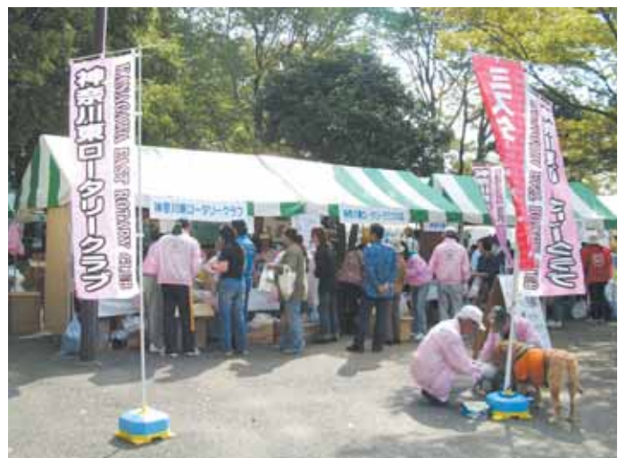
快晴で人もも順調