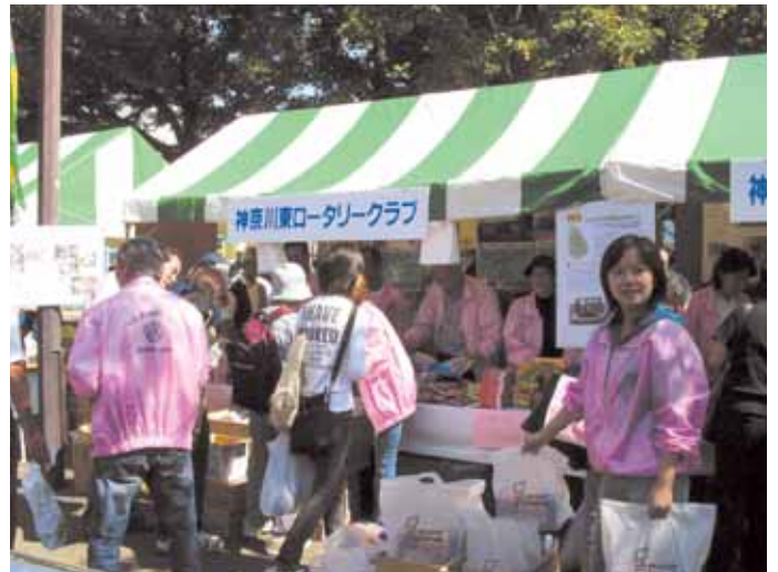
ミスタードーナツも飛ぶように売れました