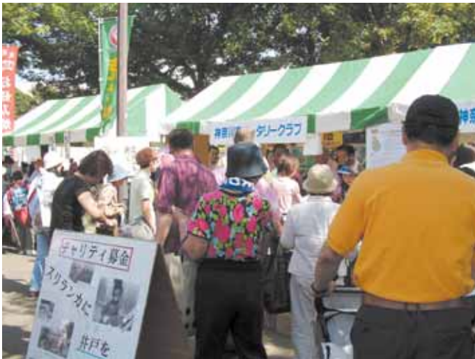
あっという間に大盛況