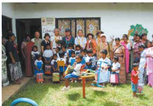
遊具のある中庭で記念撮影