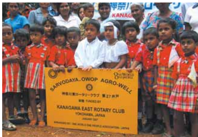
子供達も正装して参加