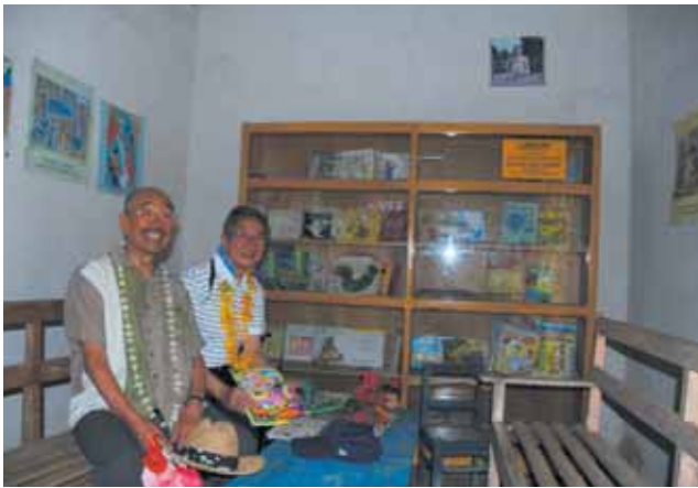
翻訳絵本の納められた書庫です