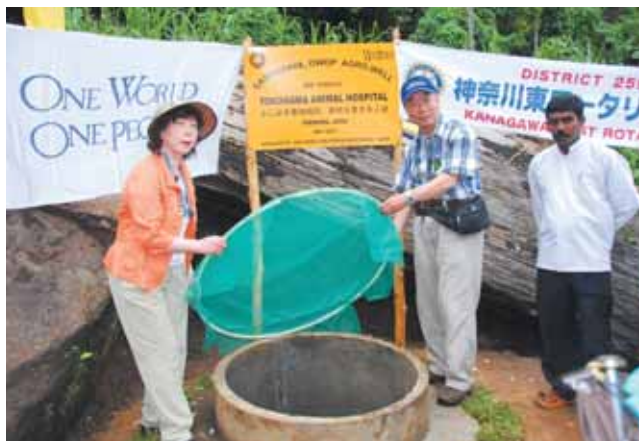
ヨコハマ動物病院・2番目の井戸で