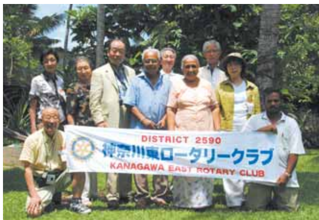
アリ博士を表敬訪問