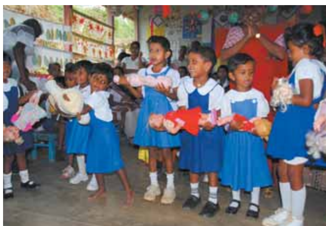
園児がお人形の歌で歓迎