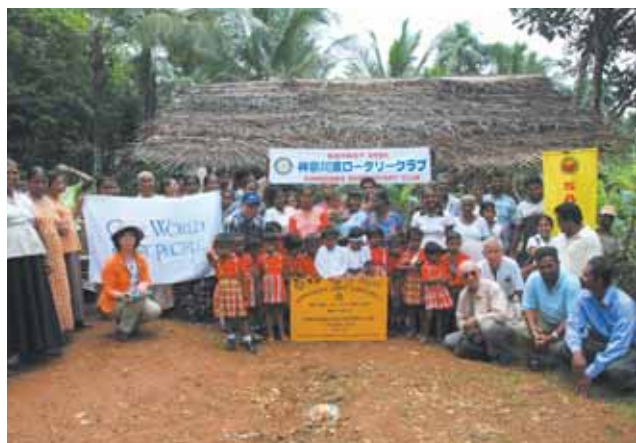
クラブ27番目の井戸の贈呈式で

井戸が所在するこの村は、中流と貧困の人たちで成り立っていますが、住民の協力関係は良いとのことでした。4月に完成間際でしたが井戸の外壁が大水で壊れ、修復もその後のたび重なる雷雨で思うようにならなかったようです。8月には完成の予定だそうです。農業用と飲料用に利用されます。