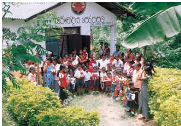
幼稚園では園児達がお出迎え