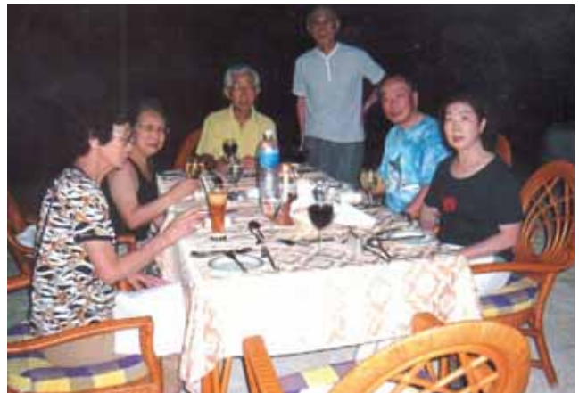
南十字星の下で 白い砂浜でディナーを