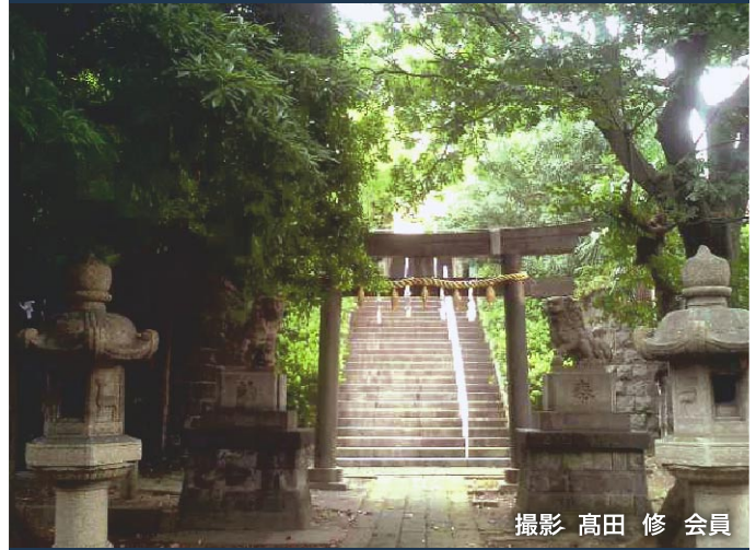
撮影 高田 修 会員